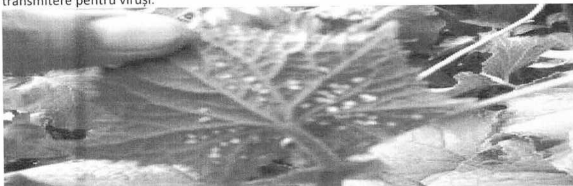
Păianjenul (acarianul) roșu ( Tetranychus urticae )

Musculița albă de seră ( Trialeurodes vaporariorum )-denumită și musculița alba de seră, este un dăunător caracteristic culturilor crescute în spații protejate. Are 3 etape de dezvoltare: ou, 4 stadii larvare și adult, toate etapele având loc pe partea inferioară a frunzei. Adulții și larvele musculiței albe invadează frunzele, mai ales lăstarii pe care le înțeapă și le sug seva din țesuturi, fapt care conduce la îngălbenirea frunzelor, care se usucă și cad. Adulții prezintă un vector de transmitere pentru viruși.